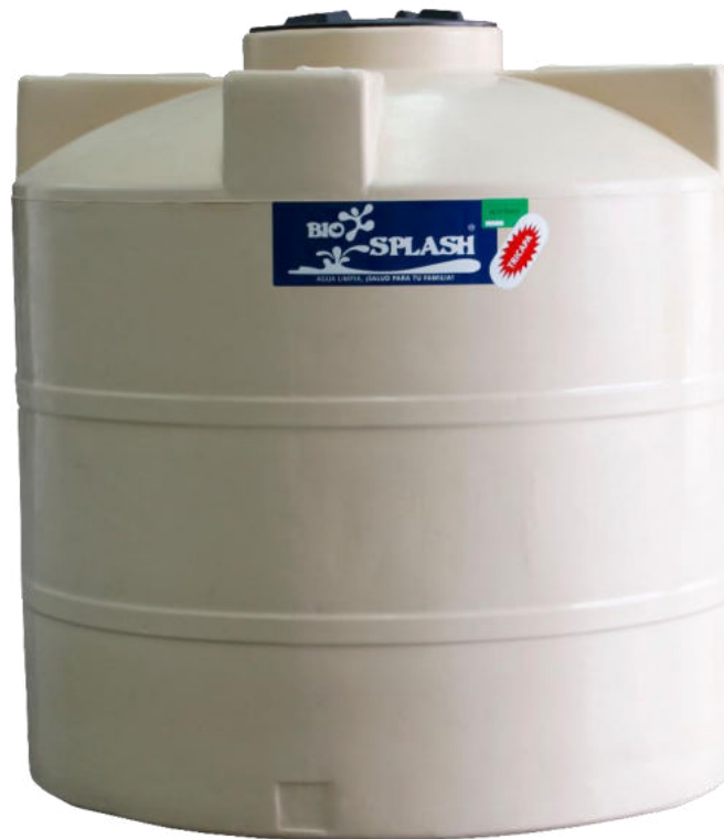
Cisterna 2,500 Lts. Bicapa