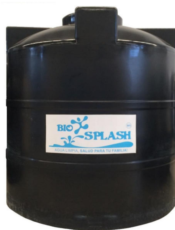
Cisterna 2,500 Lts. Monocapa